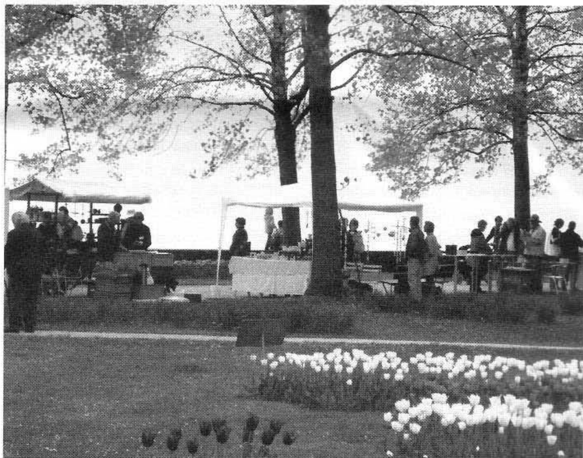
80 potiers dans les tulipes

jeunes. Pourtant, le comité n'a pas chômé afin de les motiver à participer. Question organisation, on note l'impression des cartons d'invitation très à l'avance et le choix «d'envois solidaires». Autre idée retenue du sondage de l'année passée: faire déambuler un homme-sandwich au marché de Morges le samedi matin. A signaler aussi : une nouvelle affiche charmante et très parlante qui sera réutilisée chaque année dans de nouvelles couleurs. La presse locale a joué le jeu tandis