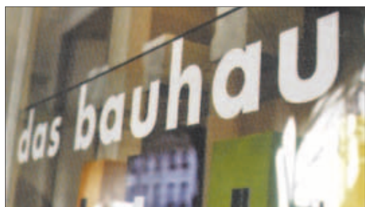
Auch «Das Bauhaus» an der Gerechtigkeitsgasse ist dabei.

Gestaltung und Produktion: Manuela Weisskopf, Regula Zatti