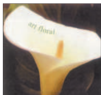
Blütenzauber im Art Floral an der Gerechtigkeitsgasse.