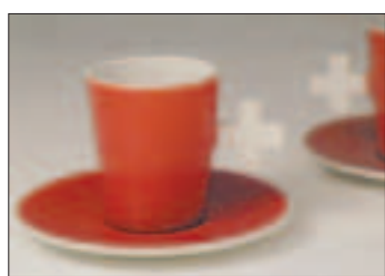
«swiss linea mocca»-Tassen im Berner Heimatwerk an der Kramgasse.